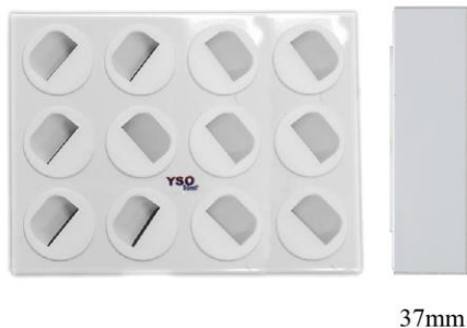
Tryckfall-flöde över tilluftsdon art nr: YSO 16012012